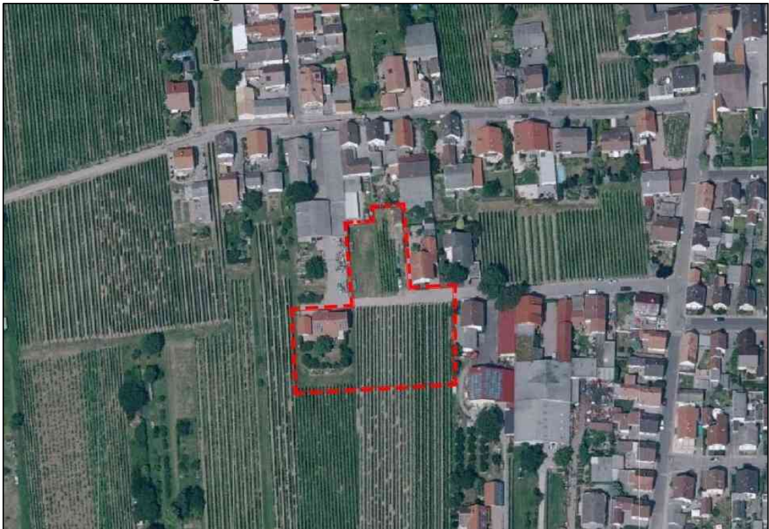
Abb. 2: Luftbild mit Geltungsbereich