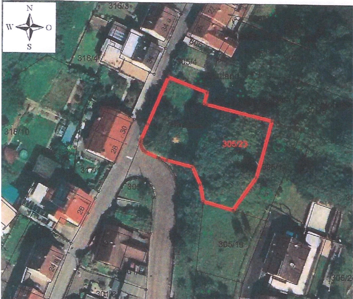
Abb. 1 Luftbild mit Abgrenzung des Geltungsbereiches

Der räumliche Geltungsbereich der Ergänzungssatzung „Flurbergstraße“ der Ortsgemeinde Neidenfels ist im Aufstellungsbeschluss näher konkretisiert und nachfolgend dargestellt: