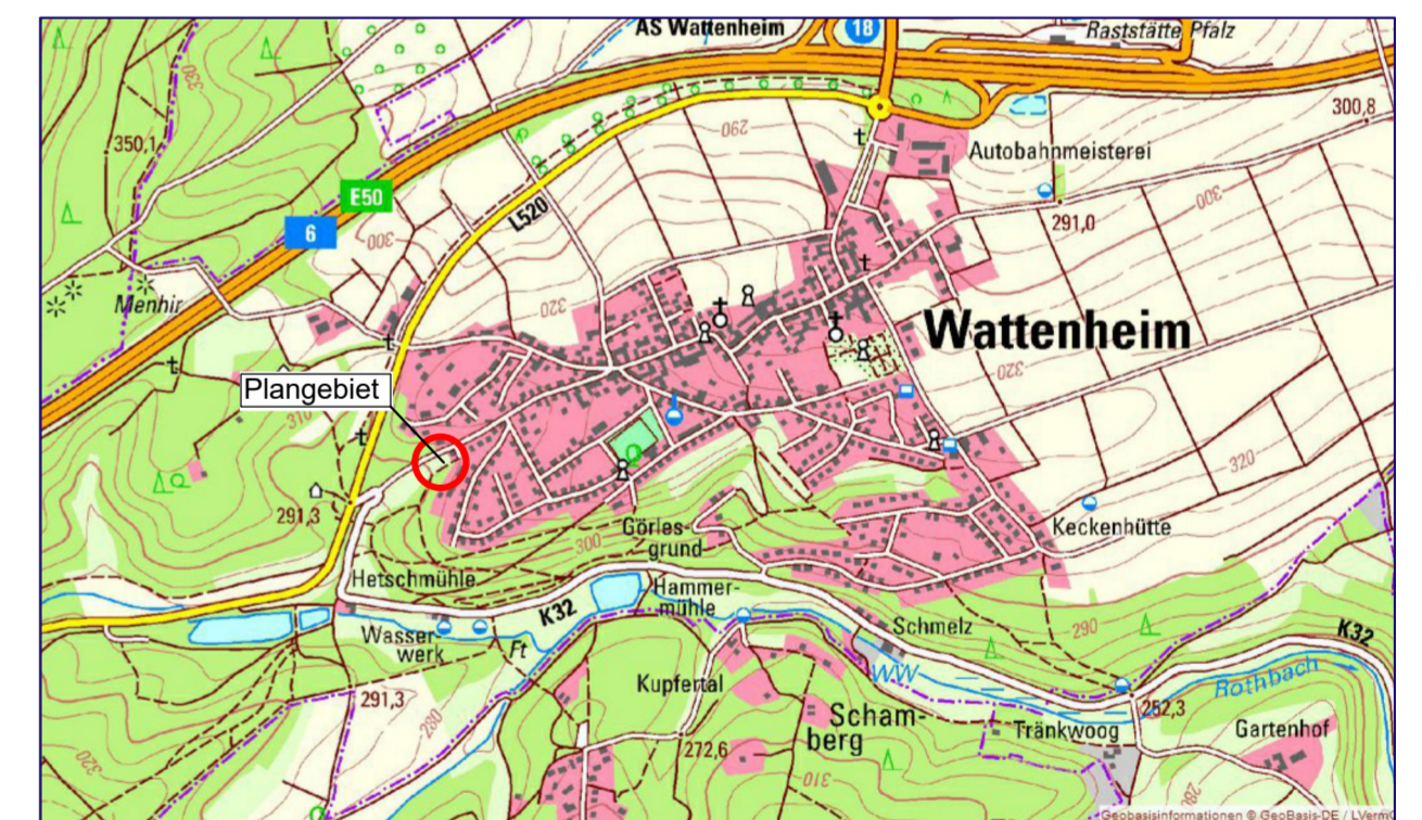
Lage des Plangebietes (rot gekennzeichnet) im Siedlungsgefüge