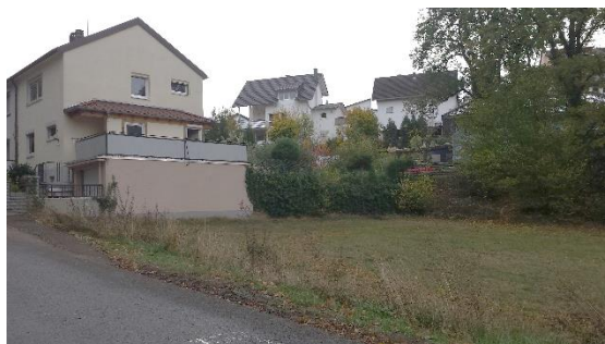
Blick auf den östlichen Teil des Plangebietes mit angrenzender Wohnbebauung

Nachfolgende Abbildungen wurden während einer Begehung am 30.10.2018 durch das Planungsbüro BBP Stadtplanung Landschaftsplanung PartGmbH Kaiserslautern aufgenommen: