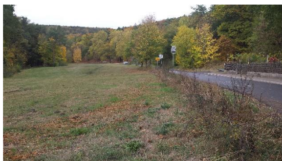
Blick vom Plangebiet nach Westen