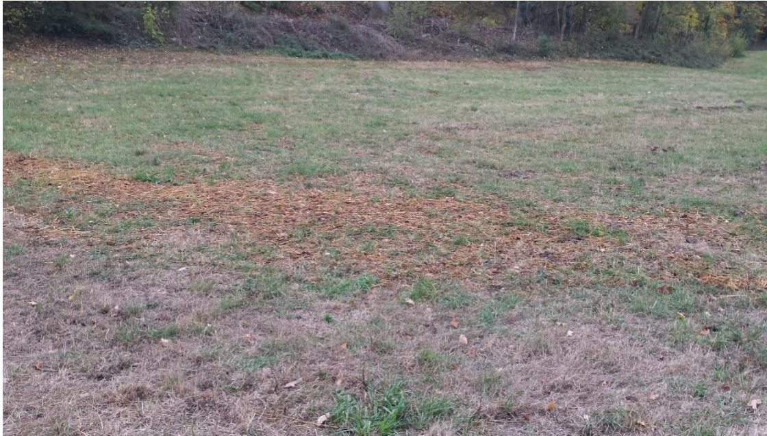
Intensiv genutzte Wiesenfläche im Plangebiet