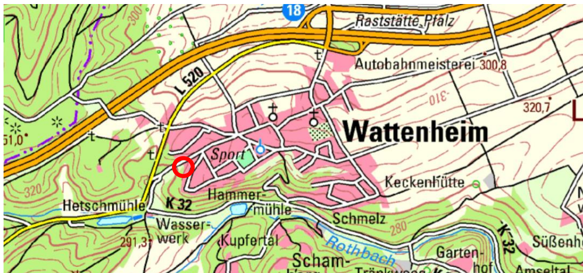
Lage des Plangebietes (rot gekennzeichnet) im Siedlungsgefüge