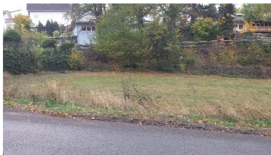
Blick auf das Plangebiet