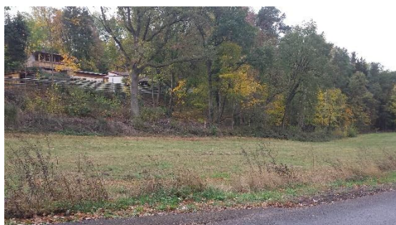
Blick auf den westlichen Teil des Plangebietes mit angrenzenden Wald- und Wiesenflächen