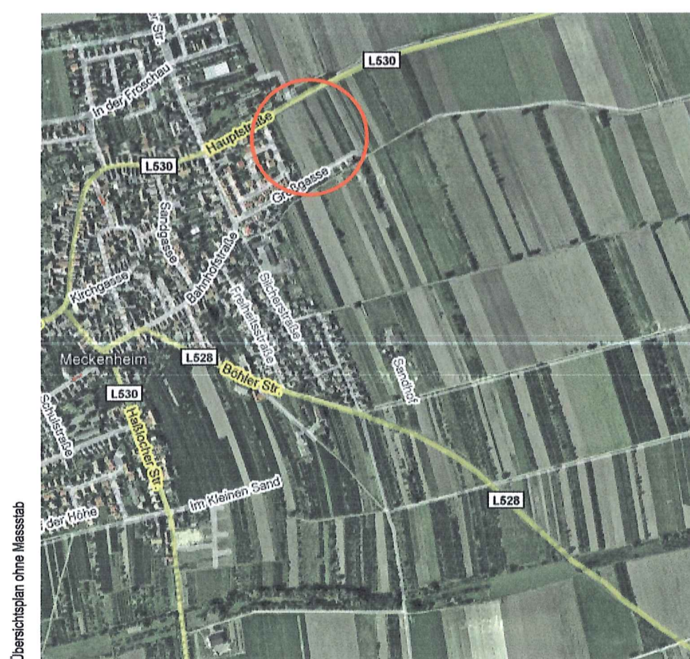
Übersichtsbild ohne Maßstab