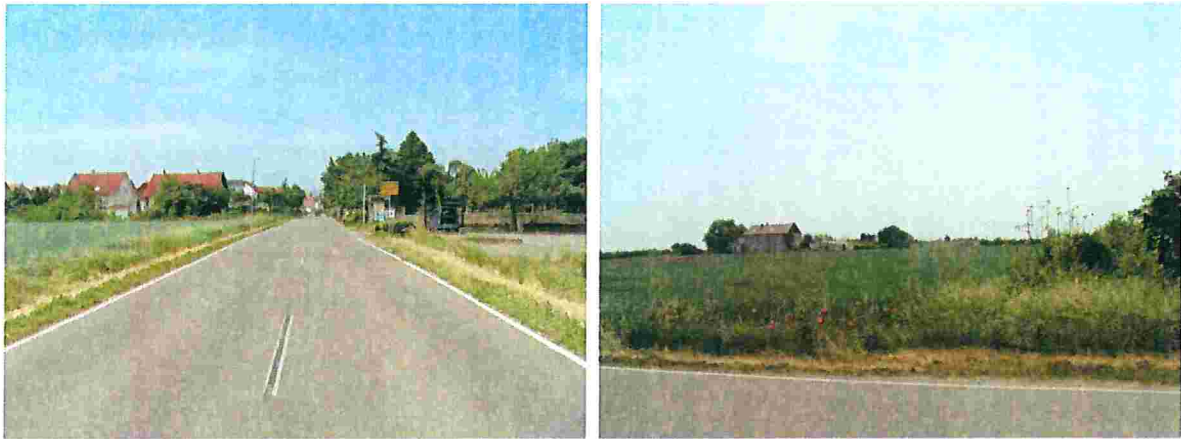
Foto 1: Ortsrand von Osten; links der Straße das Plangebiet, rechts der Friedhof