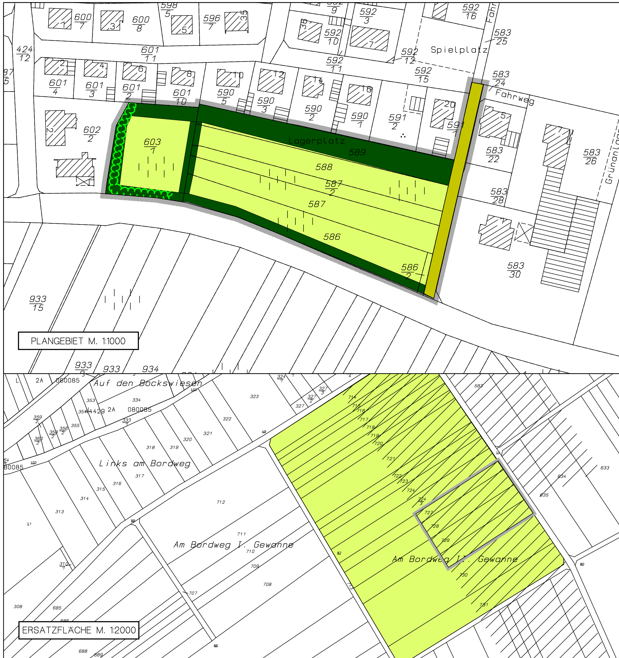
PLANGEBIET M. 1:1000