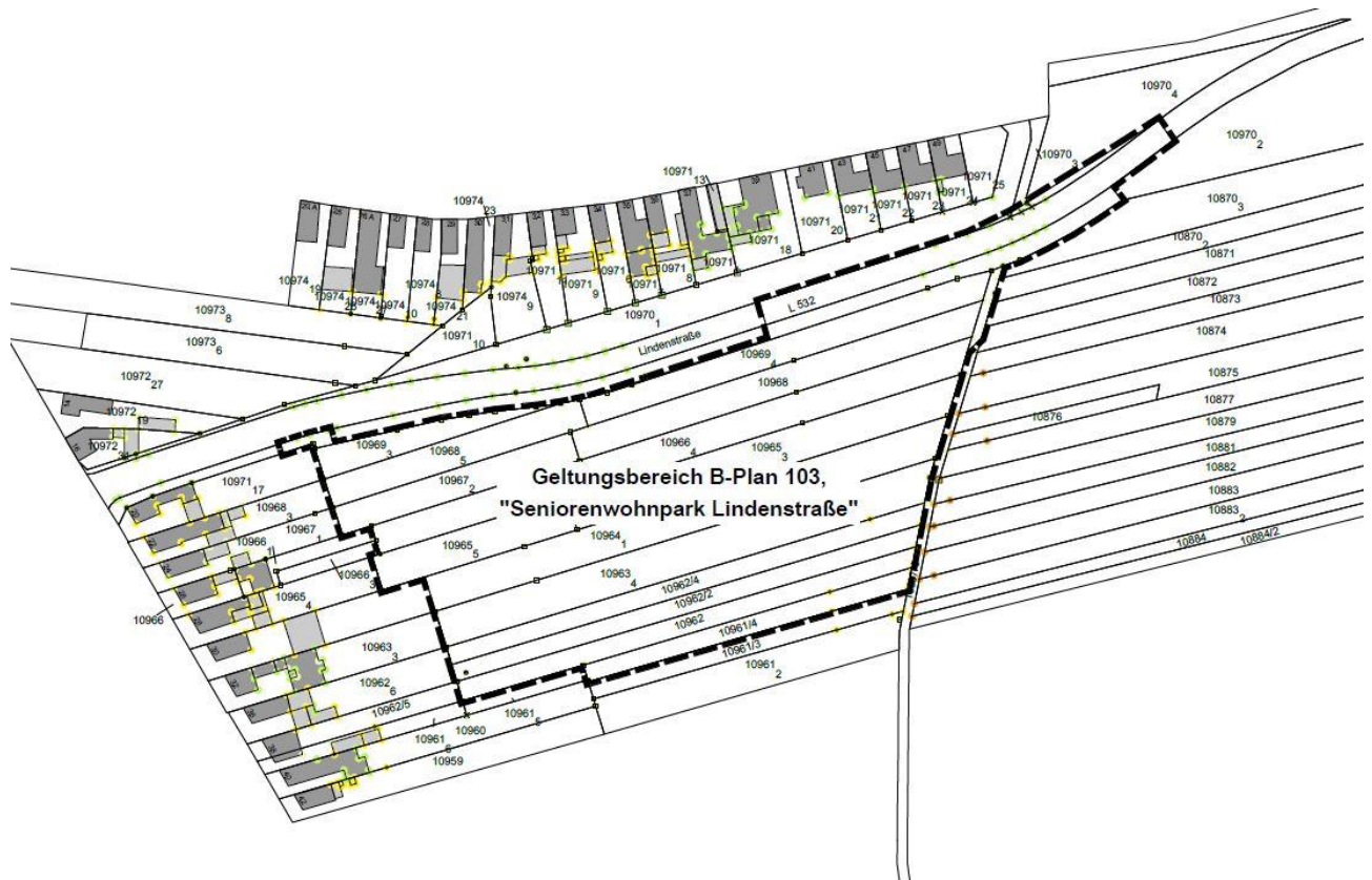
Abbildung: Grenze des räumlichen Geltungsbereiches im Katasterauschnitt

Eine sich in Arbeit befindende Verkehrsplanung entwirft derzeit die konkreten Anschluss- und Querungsmöglichkeiten an die Lindenstraße. Um der Verkehrsplanung Raum zu schaffen wird im weiteren Verfahren der Geltungsbereich konkretisiert und angepasst.