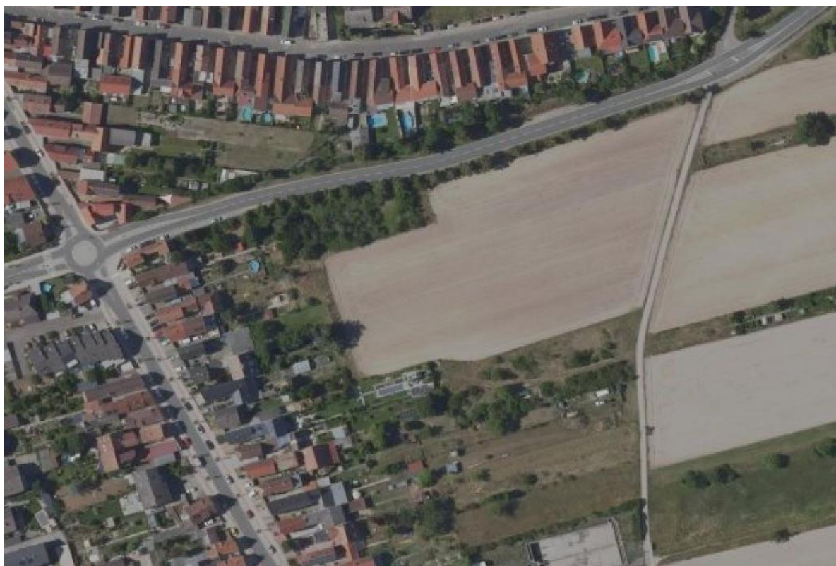
Abbildung: Luftbild des Plangebietes