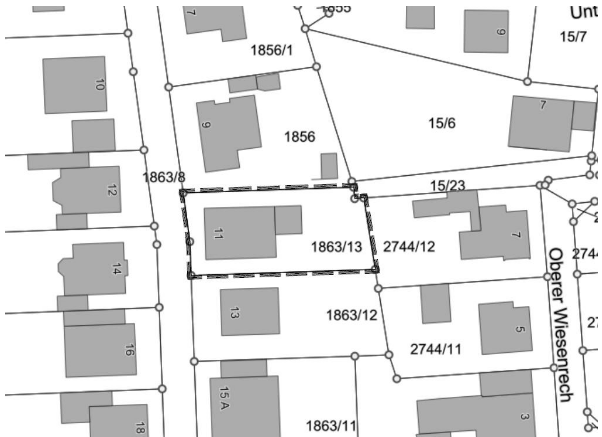
Abbildung 3: Grenze des räumlichen Geltungsbereiches.

Das Plangebiet befindet sich im Westen der Gemeinde Großkarlbach und umfasst das Flurstück 1863/13. Die Abgrenzung ist in der nachfolgenden Abbildung dargestellt. Die Gesamtfläche des Plangebietes umfasst 572 m 2 .