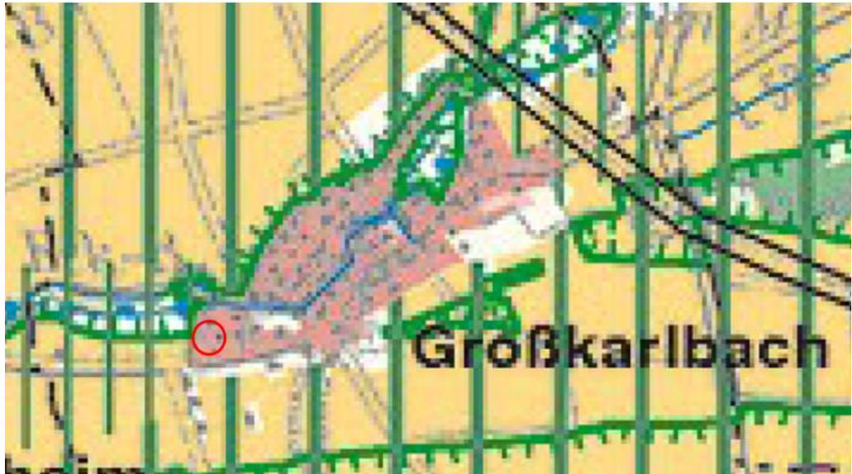
Abbildung 1: Ausschnitt aus dem Einheitlichen Regionalplan Rhein-Neckar (Raumnutzungskarte West) Die Verbandsgemeinde Leiningerland entstand zum 01.01.2018 aus der Fusion der ehemaligen Verbandsgemeinden Hettenleidelheim und Grünstadt-Land.

Gemäß § 204 Abs. 2 BauGB gelten bestehende Flächennutzungspläne in einem solchen Falle fort. Daher ist der Flächennutzungsplan der ehemaligen Verbandsgemeinde Grünstadt-Land vom 07.05.2001 maßgebend. Dieser weist den Geltungsbereich als Wohnbauflächen (Planung) aus. Der Bebauungsplan ist somit aus dem Flächennutzungsplan entwickelt.