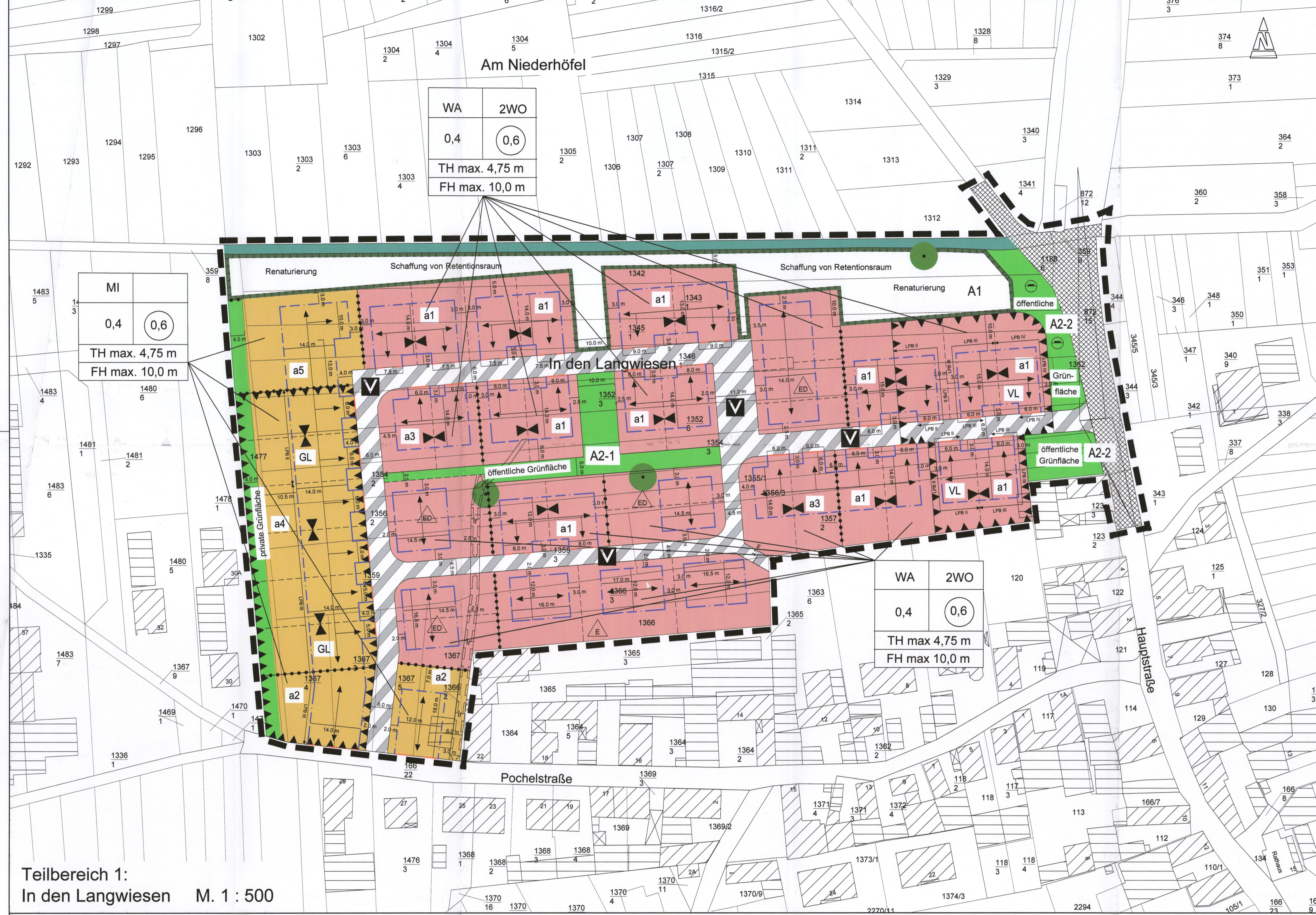
Teilbereich 1: In den Langwiesen M. 1 : 500