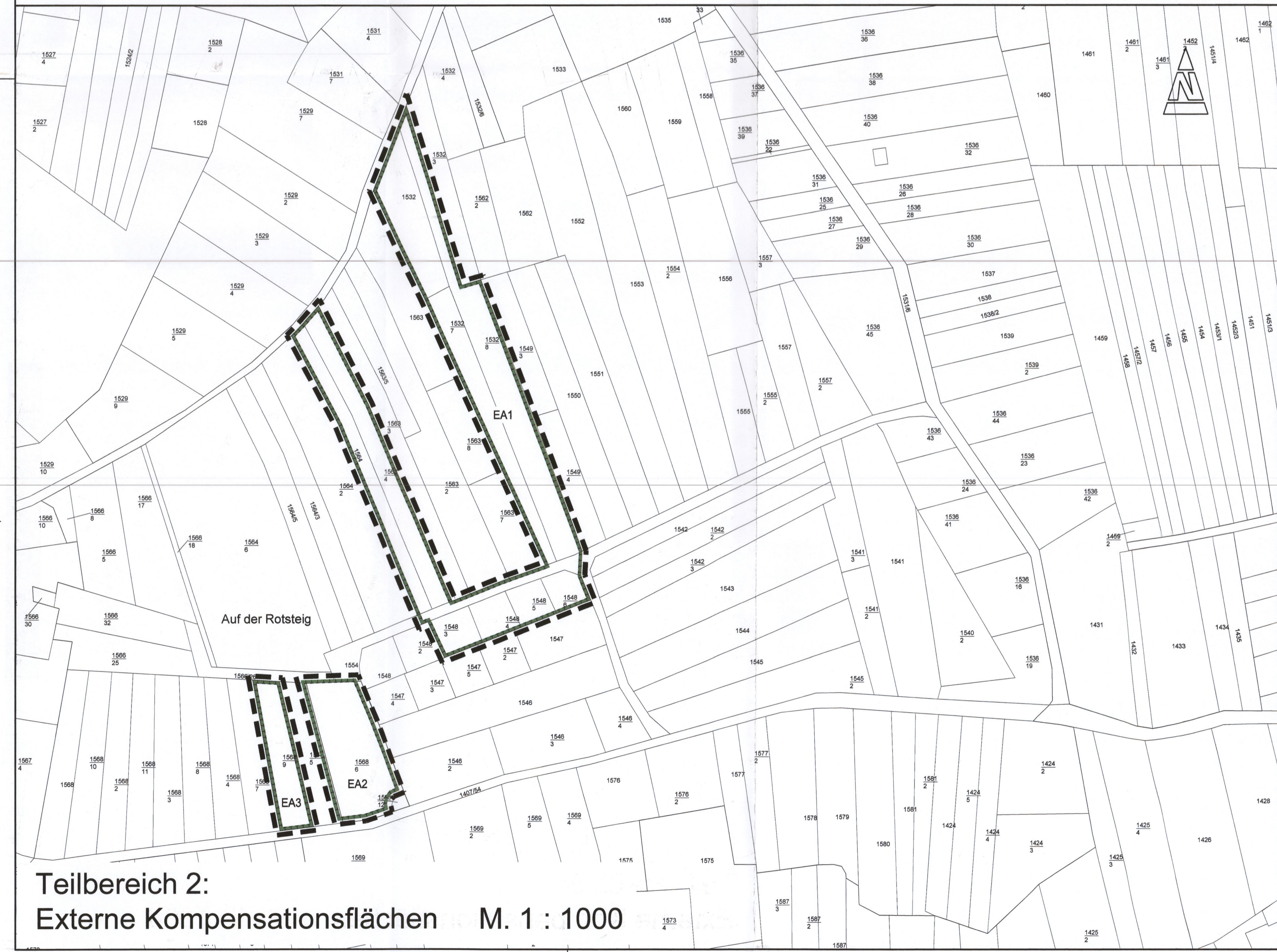
Teilbereich 2: Externe Kompensationsflächen M. 1 : 1000