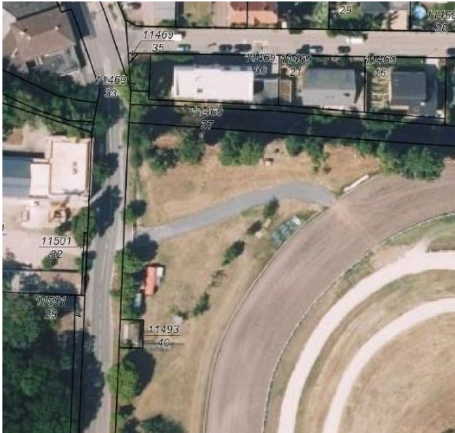
Abbildung: Luftbild des Plangebiets.

Die nachfolgende Abbildung stellt den Geltungsbereich im Luftbild dar.