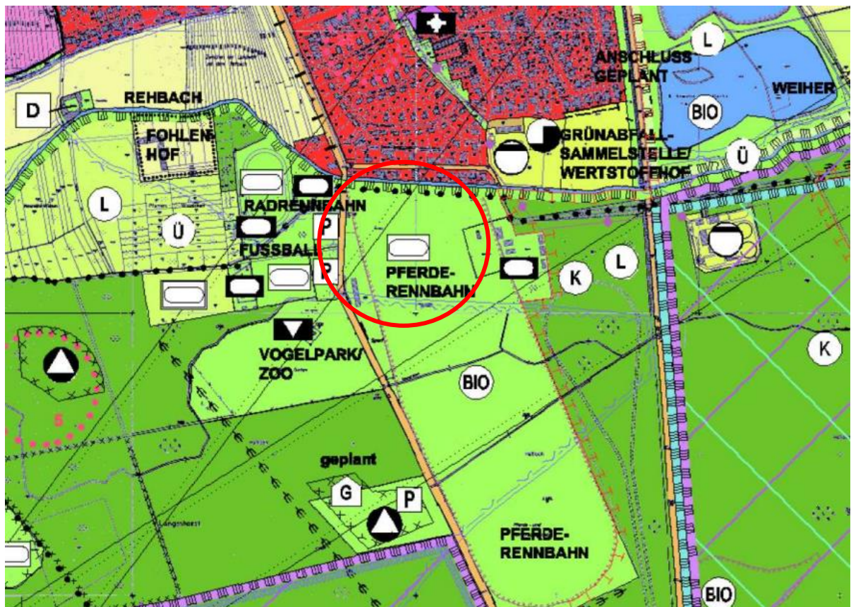
Abbildung: Ausschnitt aus dem Flächennutzungsplan.

Die Abweichung des Bebauungsplans von den Darstellungen des Flächennutzungsplans macht eine Änderung des Flächennutzungsplans erforderlich. Diese wird im Parallelverfahren mit der Bebauungsaufstellung durchgeführt.